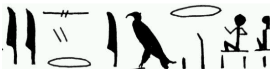
Inscriptie op de Merenptah-stèle over Israel

Het gaat om de drie rechtse tekens: Een zittende man en een zittende vrouw, en een