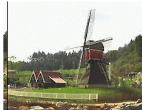
Nederland heeft een eigen cultuur

2. Ook heeft de Heere dit ons land, van tijd tot tijd, door middel van koophandel, welke Hij heeft uitgebreid over de gehele aardbodem, alzo grootelijks in aardse macht, rijkdom, sieraad, hoogheid en heerlijkheid gezegend, dat wij van de geringste beginselen tot een zeer hoge top van eer en luister zijn opgestegen,