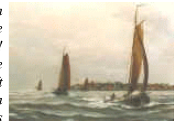
Urk in oude tijden

4. Ja, de Heere heeft dit ons land ook zo genadiglijk begunstigd boven meest alle anderen landen des aardrijks met de kandelaar van Zijn Goddelijke Woords en het zuivere licht van Zijn waarheid en Godsdienst. Hij heeft ons met Zijn machtige hand verlost, eerst uit het goddeloze heidendom, en vervolgens uit het anti-christelijke Papendom; en uit dat wrede diensthuis der helse pauselijke inquisitie, daar dit verenigd Nederland zovele eeuwen lang als in verzonken en begraven had gelegen. O! Wat heeft de Allerhoogste God daartoe niet al genade en goedertierenheid en grote wonderen aan dit land gedaan! Wie zoude die allen in orde kunnen verhalen? Men heeft immers gehele boeken geschreven van de wonderen des Allerhoogsten aan en over Nederland, door dit land van zijn dreggoden te zuiveren en te reformeren.