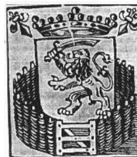
De omheinde Nederlandse hof (tuin)

http://www.bijbelnet.org/zebulon/08Hof.htm