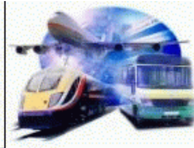
Nederland heeft modern transport

“Zevoelen vestigt zich aan zeestranden, hij stelt zich voor schepen open als een haven, die zich tot aan Tsidon uitstrekt”. Waarbij de kanttekening staat: “Zevoelen betekent “voorraad” en hij doet zijn naam eer aan door het grote aantal bevoorradingsschepen dat zijn haven aandoet”.