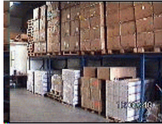
Grote magazijnen, bevoorrading