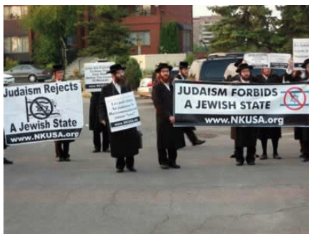
Orthodoxe joden protesteren tegen de huidige staat Israël

De volgende brandende vraag is, of Nederland kan behoren tot de verloren stammen van Israël? Deelt Nederland in de herstelprofetie?